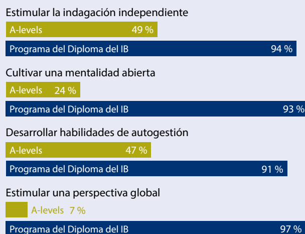
Figura 1: ¿Hasta qué punto cree que estos sistemas de exámenes desarrollan las siguientes cualidades de los alumnos en la actualidad?