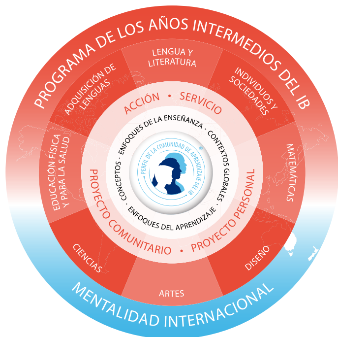
Figura 1: El modelo del PAI

El perfil de la comunidad de aprendizaje del Bachillerato Internacional (IB) articula diez atributos de carácter académico, social y emocional, que desarrollan los alumnos durante toda su experiencia educativa. Uno de los objetivos principales de la educación del IB es el desarrollo de estos atributos. Al igual que en todos los modelos de los programas del IB, el perfil de la comunidad de aprendizaje constituye el núcleo del modelo del Programa de los Años Intermedios (PAI) (Figura 1).