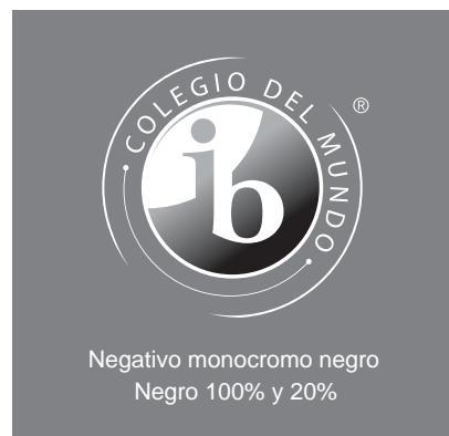
Negativo monocromo negro Negro 100% y 20%