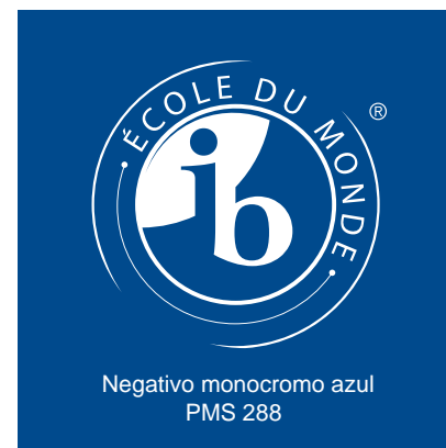
Negativo monocromo azul PMS 288