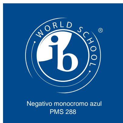
Negativo monocromo azul PMS 288