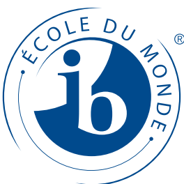
Positivo monocromo azul PMS 288